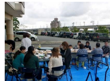
職員バーベキュー※